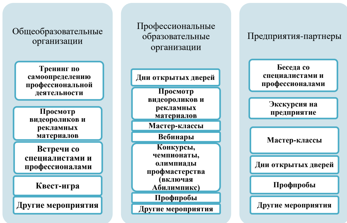
Рис. 4. Типовые мероприятия профориентации обучающихся с ограниченными возможностями здоровья и инвалидностью

образовательной организации, в том числе базовой профессиональной образовательной организации и ресурсного учебно-методического центра, а также на базе работодателя. При этом знакомство с профессиями и специальностями может проводиться педагогами, психологами образовательной организации, специалистами сопровождения, представителями профессиональных образовательных организаций, сотрудниками предприятий-партнеров. Таким образом, можно представить типовые мероприятия и профессиональные практикумы по профориентации лиц с ОВЗ и инвалидностью в следующем виде (см. Рис 4.):