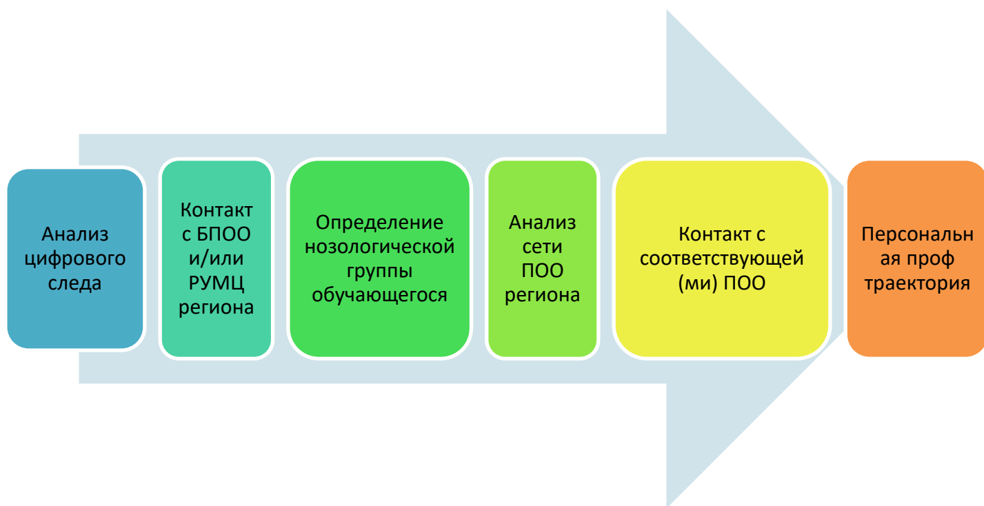
Рис.3. Алгоритм использования навигатора педагогом-навигатором